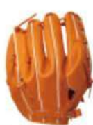
ライナーバック型